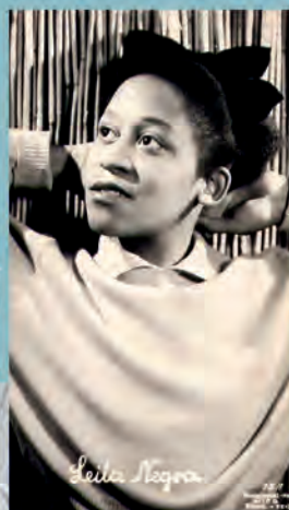
Marie Nejar (born 1930) German singer and actress.

is a project that examines the history of the black population in Germany during National Socialism through collaborative, intergenerational and reflective activities.